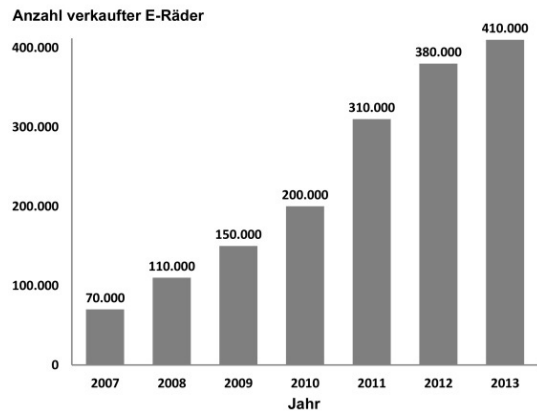
Abb. 1: Entwicklung des E-Bike Verkaufs in Deutschland (nach WACHOTSCH et al. 2014)

Als Datengrundlage dienen kostenfrei verfügbare Datensätze, die von der Stadt Berlin, dem Amt für Statistik Berlin-Brandenburg, dem Open-Data-Portal Berlin und dem Berliner Geoportal FIS-Broker bereitgestellt werden. Dazu gehören Daten zu Lebensweltlich orientierten Räumen (LOR), zur Flächennutzung, Demographie sowie sozioökonomische Daten. Die Modellierung von Einzugsgebieten erfolgt auf der Datengrundlage von OpenStreetMap (OSM). Daten zu Verkehrsverbindungen und Beförderungszahlen des öffentlichen Personennahverkehrs werden ebenso eingebracht. Zudem werden Standortdaten von kulturellen Einrichtungen, Veranstaltungsorten und sonstigen Hot Spots implementiert, die Bestandteil des OSM-Datenpakets sind. Bei zukünftiger kommerzieller Nutzung des entwickelten Tools können zusätzlich Daten integriert werden, die für die Anforderungen der jeweiligen Anwendung erhoben werden. Als Untersuchungsgebiet wurden exemplarisch sieben zentral gelegene Ortsteile von Berlin verwendet, in denen 723.049 Einwohner leben (AMT FÜR STATISTIK BERLIN-BRANDENBURG 2015).