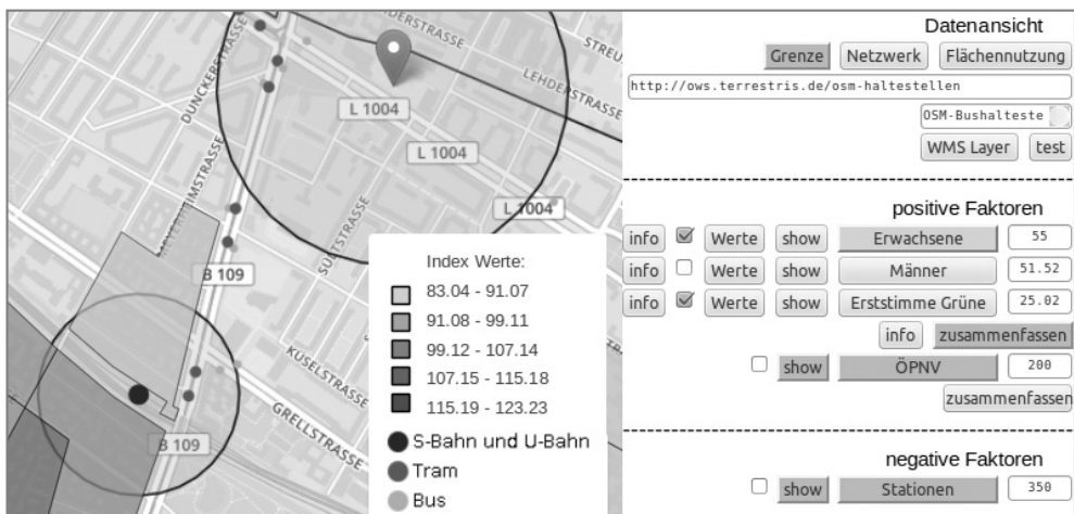
Abb. 2: Anwendungsperspektive Planer (eigene Abbildung)

Abbildung 2 zeigt die Anwendungsperspektive eines Planers. Er ist nach kurzer Einarbeitungszeit in der Lage GIS-Analysen wie Buffer und Verschneidung, zu nutzen. Der Ansatz bietet die Möglichkeit, die ausschlaggebenden Geodatensätze auszuwählen. Der Planer ist also nicht auf eine fest programmierte Kombination von Standortkriterien beschränkt, sondern die angebotenen Variablen können auf Basis einer einheitlichen und leicht erweiterbaren Datenbankstruktur und einer einfach zu bedienenden Funktionalität individuell verknüpft werden. Für jeden ausgewählten Datensatz werden Schwellwerte festgelegt, ab welcher Wertausprägung er für einen Standort als geeignet gilt. Die Flächen, die laut Schwellwert geeignet sind werden in jedem Datensatz ausgewählt und die verschiedenen Datensätze miteinander verschneidet. Die jeweils kleinräumigste Ebene aller berücksichtigten Datensätze bestimmt die Flächen, für welche die Werte angezeigt werden. In der Pilotstudie ist das die Wahllokalebene, wenn die Variable „Erststimme Grüne“ ausgewählt wird.